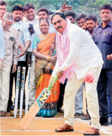
పాలకుర్తి నియోజకవర్గ పరిధిలోని తోడూరులో వివిధ గ్రామాల బీఆర్ఎస్ కార్యకర్తలతో మంత్రులు ఎర్రబెల్లి దయాకర్ రావు, సత్యవతిరాధోద్ ఎన్నికలపై సమీక్ష నిర్వహించారు. స్వాముల కాంగ్రెస్ కావాలా..? స్వీముల బీఆర్ఎస్ కావాలా ప్రజలు తేల్చుకోవాలని వారు సూచించారు. అలాగే తోడూరు మండలం కంఠాయపాలెంలో క్రికెట్ టోర్నీని ప్రారంభించి బ్యాటింగ్ చేసి శ్రేణుల్లో ఉత్సాహం నింపారు.

ఆత్మీయ సమ్మేళనాలు, ఇతర పార్టీల వెలుపలా చేరికలు, నిత్యం నాయకులు, కార్యకర్తలతో సమావేశాలతో పాటు పాటు రోజుకో ప్రాంతంలో కలియబిరుగుతూ బీఆర్ఎస్ అభ్యర్థుల ప్రచారం ఉత్సాహంగా సాగుతోంది. ఉదయం నుంచి రాత్రి వరకూ అలుపిరగకుండా నియోజకవర్గాన్ని చుట్టి వస్తూ జనానికి దగ్గర అవుతున్నారు. వెళ్లిన ప్రతి చోటల్లా శ్రేణులు, స్థానిక ప్రజలు మద్దతుగా వస్తూ సాదరంగా స్వాగతిస్తుండడంతో విజయోత్సాహంతో ముందుకు సాగుతున్నారు. అభివృద్ధి, సంక్షేమ పథకాలను ప్రచార అస్త్రాలుగా చేసుకుంటూనే ప్రతిపక్షాల మోసపూరిత హామీల నమ్మి ఓటును వృథా చేసుకోవద్దని కోరుతున్నారు. యువతను, వృద్ధులను ఆప్యాయంగా పలుకరిస్తూ, మరోసారి బీఆర్ఎస్ కారు గుర్తుకు ఓటిసి ఎమ్మెల్యేలుగా గెలిపించాలని అభ్యర్థిస్తున్నారు.