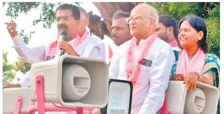
ఇబ్రహీంపట్నంలో మాట్లాడుతున్న ఎమ్మెల్యే రాజేందర్ రెడ్డి