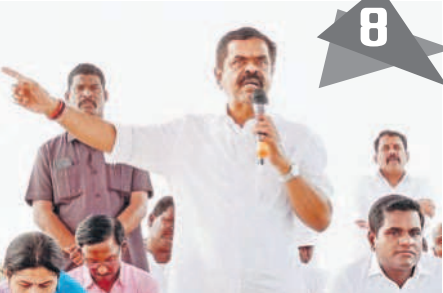
కార్యకర్తల సమావేశంలో మాట్లాడుతున్న ఎమ్మెల్యే చిట్టెం