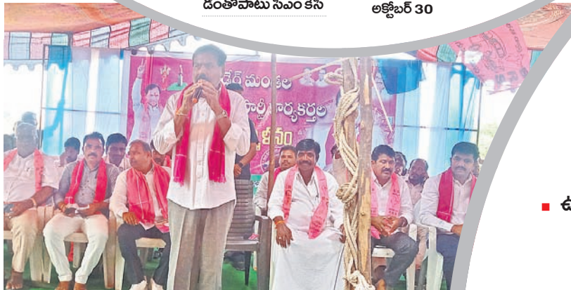
కోడేరులో నిర్వహించిన ఆత్మీయ సమ్మేళనంలో మాట్లాడుతున్న ఎమ్మెల్యే బీరం