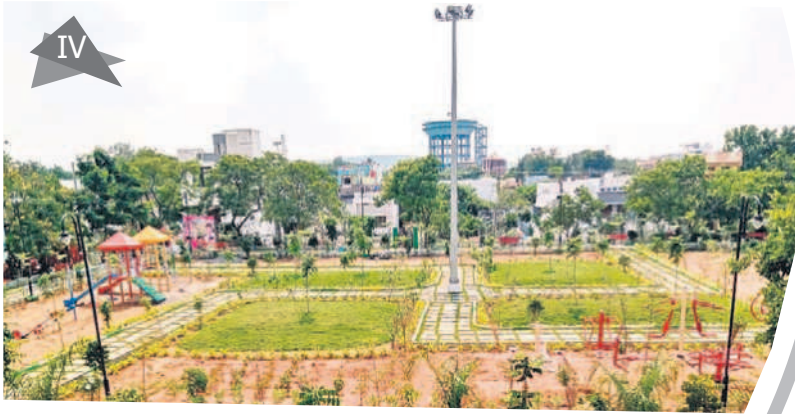
కొల్లాపూర్ చుక్కాయపల్లికాలనీలో ఏర్పాటు చేసిన పార్కు

కొల్లాపూర్ గత పాలకుల నిర్లక్ష్యం వల్ల పూర్తిగా వెనుకబడింది. పేరుకే నియోజకవర్గ కేంద్రం అయినా అక్కడ అలాంటి వసతులు లేవు. తెలంగాణ ఏర్పడిన అనంతరం అక్కడి నుంచి ప్రాతినిధ్యం వహిస్తున్న ఎమ్మెల్యే, మంత్రి అయినా పెద్ద గా ప్రయోజనం చేకూరలేదు. ఆ తర్వాత ఎమ్మెల్యే గా గెలిచిన బీరం హర్ష వర్ధన్ రెడ్డి ప్రత్యేక చొరవ తీసుకోవడంతోపాటు సీఎం కేసీ