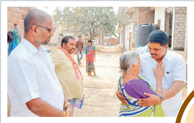
అచ్చంపేటలో ప్రచారంలో వృద్ధులాలిని ఆప్యాయంగా పలకరిస్తున్న కౌన్సిలర్