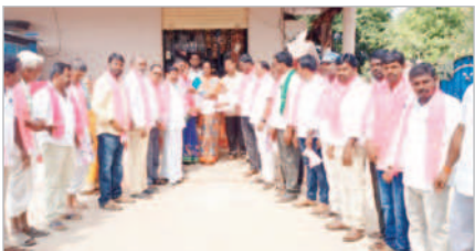
బల్లూరు: రాంనగర్ కాలనీలో...