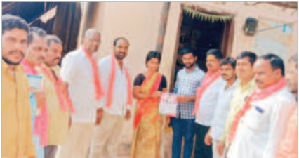
అచ్చంపేటలో 2వ వార్డులో బీఆర్ఎస్ శ్రేణుల ప్రచారం