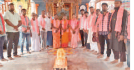
అప్రూబాద్ లో పూజలు చేస్తున్న బీఆర్ఎస్ నాయకులు