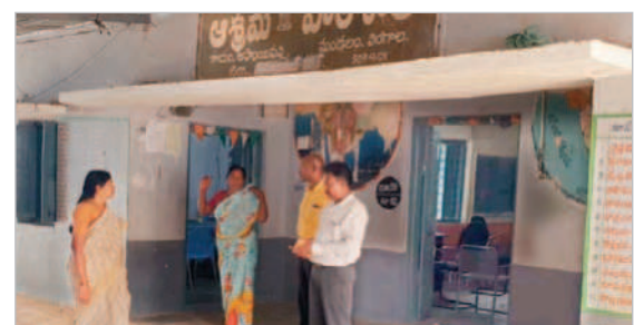
లింగాలలో పోలింగ్ కేంద్రాన్ని పరిశీలిస్తున్న ఎంపీడివో గీతాంజలి

లింగాల, అక్టోబర్ 30 : మండలంలోని అప్పాయిపల్లి గ్రామంలో ఏర్పాటు 210, 211, 212 పోలింగ్ కేంద్రాలను సోమవారం ఎంపీడివో గీతాంజలి పరిశీలించారు. ఈ సందర్భంగా ఆమె మాట్లాడుతూ నవంబర్ 30న నిర్వహించే అసెంబ్లీ ఎన్నికలకు గాను పోలింగ్ కేంద్రాలను సిద్ధం చేస్తున్నట్లు తెలిపారు. ముఖ్యంగా పోలింగ్ కేంద్రాల్లో తాగునీటి, మరుగుదొడ్లు, విద్యుత్ తదితర సౌకర్యాలను ఉన్నాయా లేదా పరిశీలించారు. పరిశీలించిన పోలింగ్ కేంద్రాల నివేదికను ఉన్నతాధికారులకు సమర్పిస్తామని ఆమె తెలిపారు. కార్యక్రమంలో బీఆర్ఎస్ తదితరులు పాల్గొన్నారు.