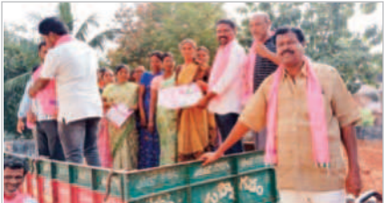
అచ్చంపేటలో కూలీలకు పథకాలు వివరిస్తున్న నాయకులు