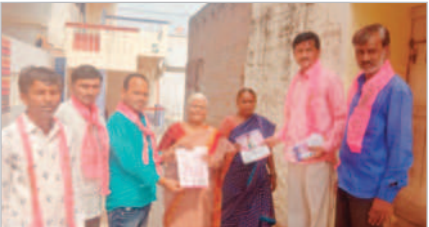
అచ్చంపేట 5వ వార్డులో ప్రచారం చేస్తున్న నాయకులు