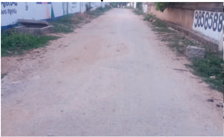
గ్రామంలో నిర్మించిన సీసీ రోడ్డు

వేములపల్లి, అక్టోబర్ 30: మండలంలోని శెట్టిపాలెం గ్రామం గత పాలకుల హయాంలో వెనుకబాటుతనానికి గురైంది. నేడు అభివృద్ధి బాట పట్టింది. బీఆర్ఎస్ ప్రభుత్వం అధికారంలోకి వచ్చినప్పటికీ రూ.46కోట్లను గ్రామాభివృద్ధి కోసం ఖర్చు చేసింది. పల్లె దవఖాసకు రూ.20లక్షలు, రైతువేదిక నిర్మాణానికి రూ.22లక్షలు, శుశాసన వాటిక, కంపోస్టు షెడ్, పల్లె ప్రకృతివనంలను రూ.19లక్షలతో నిర్మించారు. మంచి నీటి సరఫరా కోసం మిషన్ భగీరథతో ద్వారా సుమారు రూ.76లక్షలతో ఇంటింటికీ పైపులైను వేసి నల్లాలను ఏర్పాటుచేశారు.