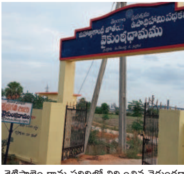
శెట్టిపాలెం గ్రామ పరిధిలో నిర్మించిన వైకుంఠధామం