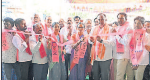
చందుర్తి : లింగంపేటలో పార్టీ కార్యాలయాన్ని ప్రారంభిస్తున్న చల్లెడ

అండగా ఉంటా.. ఆదరించండి • పార్టీ కార్యాలయ ప్రారంభోత్సవంలో చల్లెడ