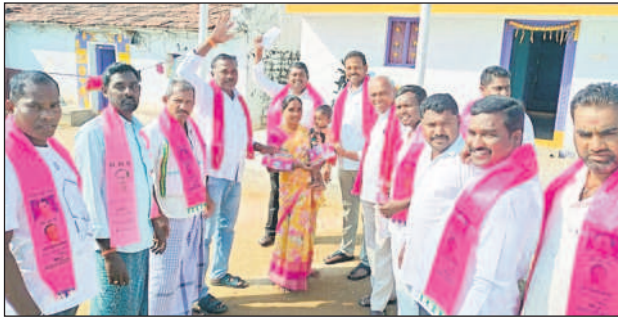
కోనరావుపేట: నిమ్మపల్లి గ్రామంలో చల్లెడకు మద్దతుగా మహిళను ఓటును అభ్యర్థిస్తున్న నేతలు