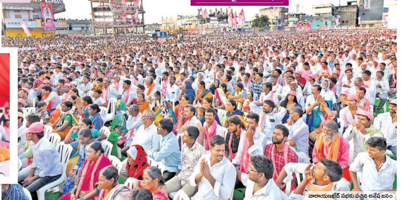
నారాయణభేడ్ సభకు వచ్చిన అశేష జనం