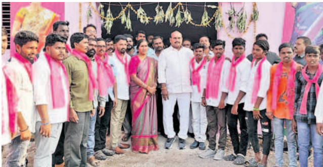
అక్కయపేటలో పార్టీలో చేరుతున్న ఆయా పార్టీల నాయకులు