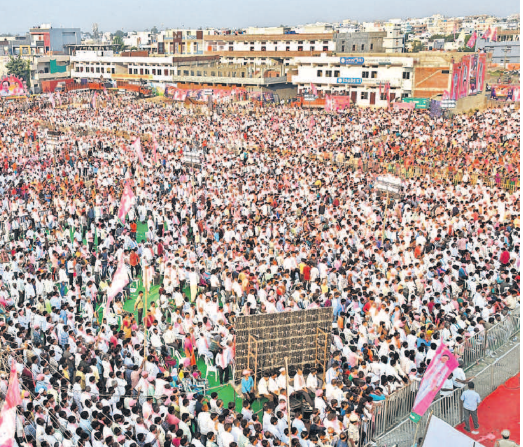
అంతస్తులు ఎక్కిన అభిమానం: ప్రజా ఆశీర్వాద సభకు హాజరైన జనం

-సిద్దిపేట, (నమస్తే తెలంగాణ ప్రతినిధి)/సంగారెడ్డి/నారాయణభేడ్, అక్టోబర్ 30