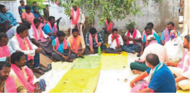
గరిడేపల్లి : మంగాపురం గ్రామ సమావేశంలో పాల్గొన్న నాయకులు