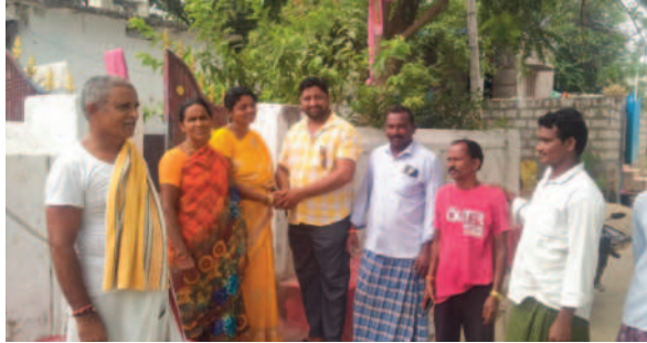
మరంపల్లి : చౌటపల్లిలో ప్రచారం చేస్తున్న బీఆర్ఎస్ శ్రేణులు