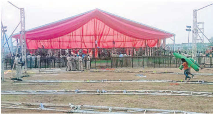
హుజూర్ నగర్ ప్రజా ఆశీర్వాద సభకు సిద్ధమైన వేదిక