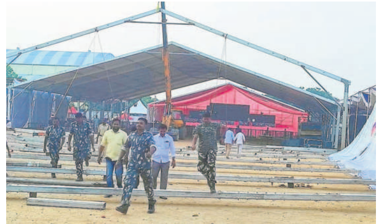
మిర్యాలగూడ ప్రజా ఆశీర్వాద సభకు పూర్తైన ఏర్పాట్లు