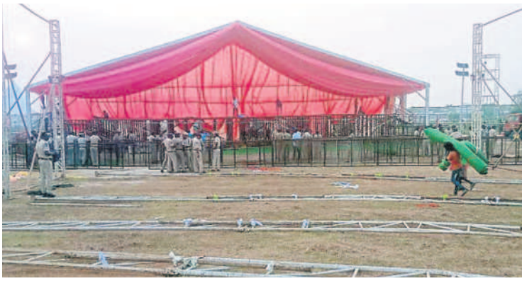
హుజూర్ నగర్ ప్రజా ఆశీర్వాద సభకు సిద్దమైన వేదిక