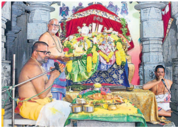
యాదాద్రిలో లక్ష్మీనరసింహుల తిరు కల్యాణోత్సవం జరిపిస్తున్న అర్చకులు