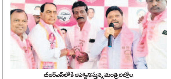
బీఆర్ఎస్ లోకి చేరిన పులిమడుగు గ్రామస్థులతో మంత్రి అల్లం ఇంద్రకరణ్ రెడ్డి