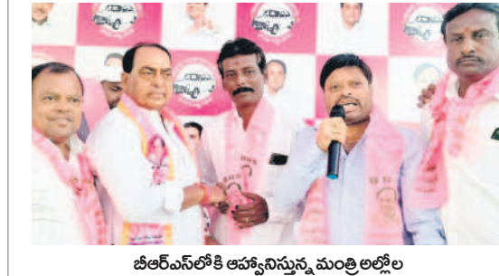
బీఆర్ఎస్ లోకి ఆహ్వానిస్తున్న మంత్రి అల్లం