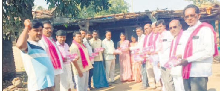
బజార్ హత్నూర్ : గోకొండలో ప్రచారం చేస్తున్న బీఆర్ఎస్ నాయకులు