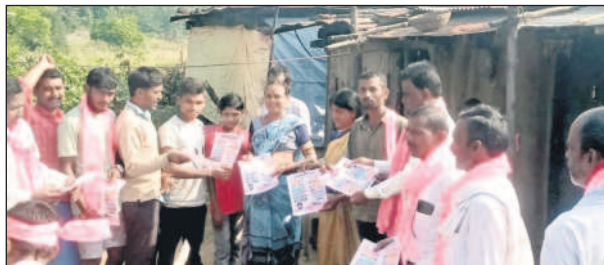
బోధ: నారాయణపూర్లో బీఆర్ఎస్ పథకాల గురించి వివరిస్తున్న కన్వీనర్, నాయకులు