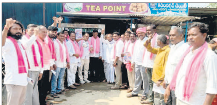
బోధ: ప్రచారం చేస్తున్న ఎంపీపీ, బీఆర్ఎస్ నాయకులు