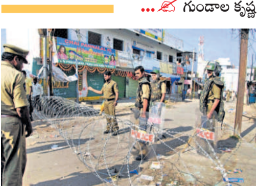
సీఎం కుల్చీ కొట్టాడే ఆ నరమేధానికి కారణం. అప్పుడు ముఖ్యమంత్రిగా వ్యవహరించిన మర్రి చెన్నారెడ్డి స్వయంగా చెప్పిన మాటలు ఇవి.. 'సన్ను సీఎం పదవి నుంచి తొలగించేందుకు సాంత పార్టీ అయిన కాంగ్రెస్ లోని ప్రత్యర్థులు చేసిన 'ఇంజనీర్డ్ వయలెన్స్' (సృష్టించిన హింస).'

ఆ రోజు... 1990 డిసెంబర్ 7.. పాతబస్తీలో అల్లర్లు.. నగరమంతా వుక్కార్లు.. రాష్ట్రమంతా అలజడి.. గంగా-యమున తహజీబ్ సంస్కృతికి నిలువుటద్దంలా ఉన్న హైదరాబాద్ నరమేధంతో నిలువునా వణికిపోయింది. మర్నాడు సూర్యుడు ఉదయించేసరికి.. రాజధాని రక్తసిక్తమైంది. ఆనాడు అల్లరిమూకలు సృష్టించిన నరమేధంలో సుమారు 300 మంది సామాన్య పౌరులు ప్రాణాలు కోల్పోయారు. ఐదారువందల మందికి గాయాలయ్యాయి. ఏకంగా 25 రోజుల పాటు హైదరాబాద్ కర్ఫ్యూ చెరలో బందీగా మిగిలింది. డిసెంబర్ చలిలోనూ నగరమంతా వేడికొంది. ఆ వేడి రాష్ట్రమంతా సిగలు కక్కింది. సున్నితమైన ప్రాంతాల్లో నెల రోజులు దినదిన గండంగా గడిచాయి.