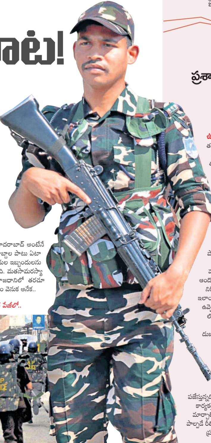
మిగతా 8వ పేజీలో..