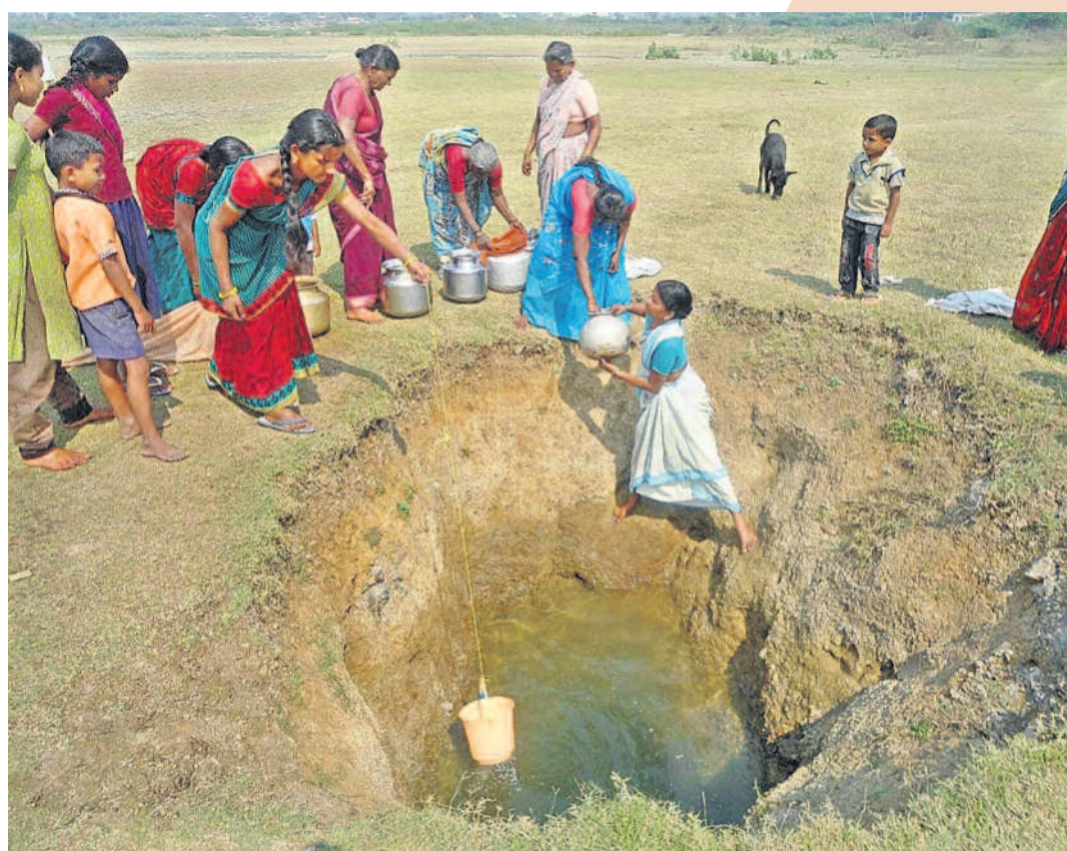
తెలంగాణ రాజకీయాలకు మందిరీతి కష్టాలకు తార్కాణం ఈ చిత్రం. భద్రాద్రి కొత్తగూడెం జిల్లా ఇల్లందు మండలంలోని గిరిజన గ్రామాల ప్రజలు తాగునీటికి గోస వడవారు. కడివెడు నీళ్ల కోసం ఊరి పొలిమేరలు దాటి.. వాగులు చేరి.. చెలిమెలు తప్పకుండా వాళ్ల కష్టం గురించి ఎంత చెప్పకొన్నా తక్కువే! మంచుతొందలో మాత్రమే కాదు, వానకాలంలోనూ నీటి ఎద్దేవి తప్పేది కాదు. గిరిజన గ్రామాల దుష్టితతో అల్లాడుతున్న గుక్కెడు నీళ్లు ఇవ్వాలని ఆలోచించలేదు నాటి పాలకులు.