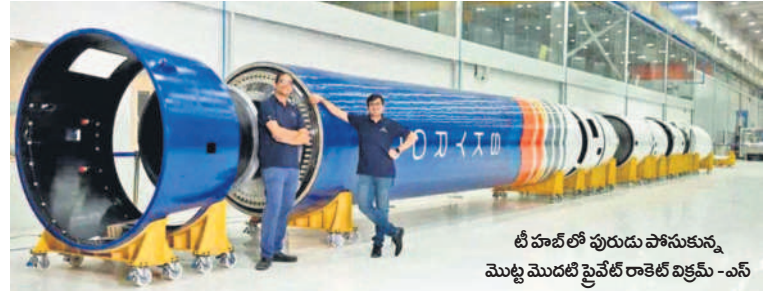
టీ హాబ్ లో పురుషుల పాపాకున్న మొట్ట మొదటి ప్రైవేట్ రాకెట్ విక్రమ్ -ఎస్