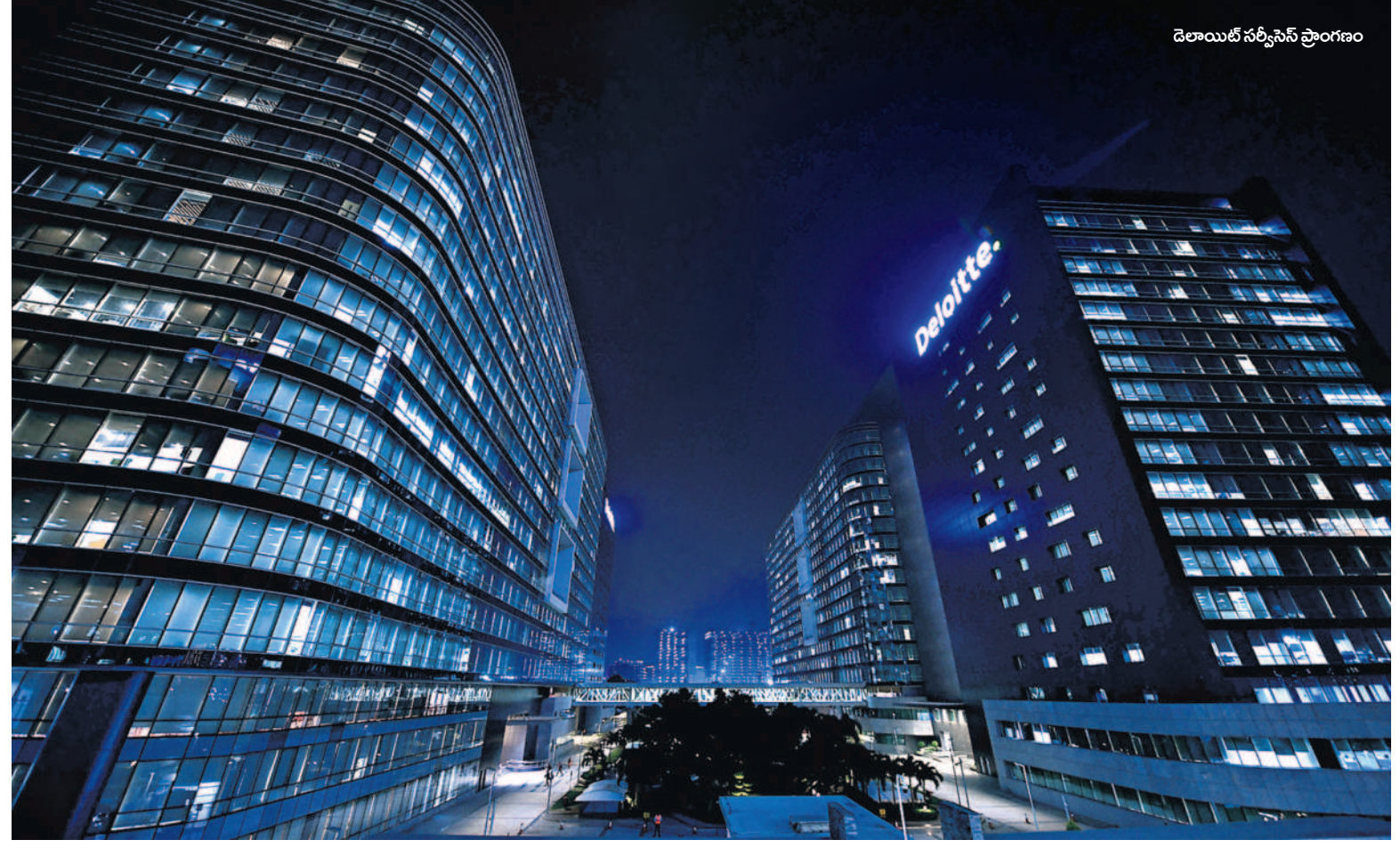
డెలాయిట్ సర్వీసెస్ ప్రాంగణం

ప్రత్యేక తెలంగాణ రాష్ట్రం ఏర్పాటుకు ముందు దేశంలో ఐటీ అంటే బెంగళూరు పేరు వినిపించేది. ప్రస్తుతం ఐటీ అంటే హైదరాబాద్. హైదరాబాద్ కేంద్రంగా ఐటీ రంగం ప్రగతి పథంలో దూసుకెళ్ళింది. ఐటీ, ఐటీఈఎస్ కార్యకలాపాల కోసం వినియోగించే ప గ్రేడ్ ఆఫీస్ స్పేస్ లీజర్లలోనూ నగరం బెంగళూరును మించింది. ఇదంతా తెలంగాణ ప్రభుత్వ విధానాలు, పనితీరు వల్లేనని ఐటీ రంగం నిపుణులు పేర్కొంటున్నారు. రాష్ట్రం నుంచి ఐటీ ఎగుమతులు 31.44 శాతం ఉండగా, దేశం నుంచి సరాసరిగా ఎగుమతుల వ్యర్ధి 9.36గా ఉందని తాజాగా వెల్లడైంది. తెలంగాణలో స్ఫుర ప్రభుత్వ పాలన, సీఎం కేసీఆర్ తీసుకుంటున్న నిర్ణయాలు ఆయా రంగాల వ్యక్తికి బాటలు వేస్తున్నాయి. ఫార్ట్యూన్ 500 కంపెనీలుగా గుర్తింపు పొందిన కంపెనీలు వదుల సంఖ్యలో హైదరాబాద్ కేంద్రంగా పనిచేస్తున్నాయి. ఐటీ రంగానికి ప్రపంచ వ్యాప్తంగా ఉన్న ప్రాధాన్యతను గుర్తించిన తెలంగాణ ప్రభుత్వం ప్రతి 5 ఏళ్లకు ఒకసారి (2016, 2021)లో ఐటీ పాలసీలను రూపొందించి సమర్థవంతంగా అమలు చేస్తోంది. వీటికి తోడు ఐటీ శాఖ పరిధిలో ఎమ్మెల్యే టిక్కాజీ వింగేను ఏర్పాటు చేసి 10 టిక్కాజీలను ప్రభుత్వ కార్యకలాపాలకు సమర్థవంతంగా వినియోగిస్తోంది. - సిటీబ్యూరో, అక్టోబర్ 31 (సమస్త తెలంగాణ)