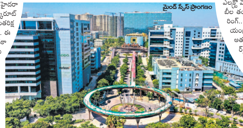
మెంట్ స్పేస్ ప్రాంగణం