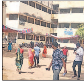
కుల్చుంపురా ప్రభుత్వ పాఠశాల పోలింగ్ బూత్లో కనిపించని రద్దీ