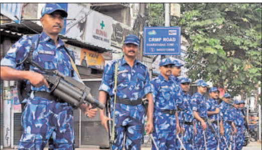
గోషామహల్ నియోజకవర్గంలో బందోబస్తు నిర్వహిస్తున్న ర్యాపిడ్ యాక్షన్ ఫోర్స్ బలగాలు - అబిడ్స్