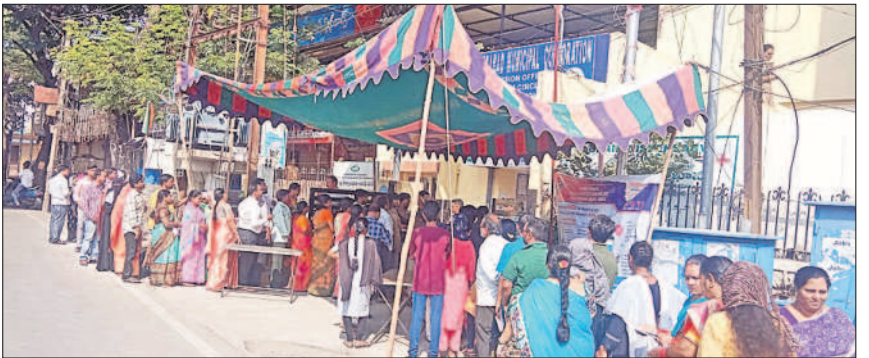
గుడిమల్యాపూర్లోని జీహెచ్ఎంసీ వార్డు కార్యాలయం వద్ద ఓటు వేసేందుకు క్యూ కట్టిన ప్రజలు