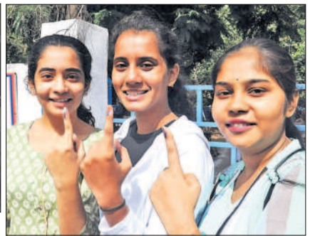
ఓటు హక్కు వినియోగించుకున్న యువతులు

గంట వరకు 15.83, మూడు గంటల వరకు 35.88 శాతం, సాయంత్రం 5 గంటల వరకు 45.79 శాతం నమోదైనట్లు రిటర్నింగ్ అధికారి విజ్ఞప్తి తెలిపారు.