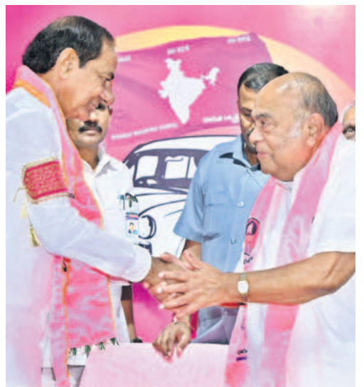
ముఖ్యమంత్రి కేసీఆర్ తో కరచాలనం చేస్తున్న మాజీ మంత్రి నాగం జనార్దన్ రెడ్డి