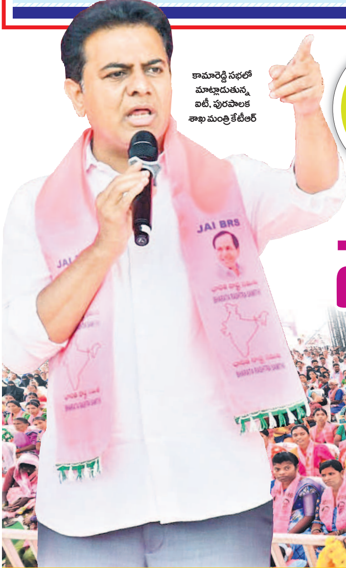
కామారెడ్డి సభలో మాట్లాడుతున్న ఐటీ, పురపాలక శాఖ మంత్రి కేటీఆర్