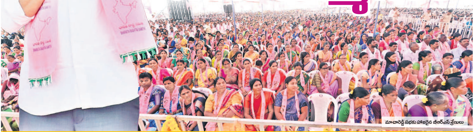
మాచారెడ్డి సభకు హాజరైన బీఆర్ఎస్ శ్రేణులు