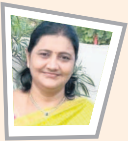
పైసా ఖర్చు లేకుండా ప్రభుత్వ ఉద్యోగి అయ్యాడు

- డాక్టర్ ఎల్లారెడ్డి, రైతు, గంగాధర మండలం