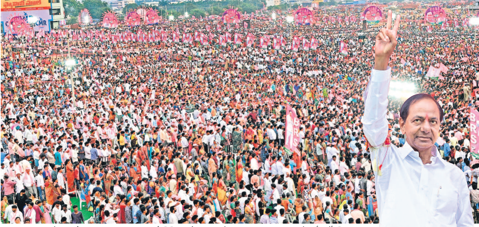
నల్లగొండ జిల్లా దేవరకొండలో మంగళవారం సాయంత్రం నిర్వహించిన బీఆర్ఎస్ ప్రజా ఆశీర్వాద సభకు అశేషంగా తరలివచ్చిన ప్రజలు.. అభివాదం చేస్తున్న సీఎం కేసీఆర్