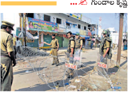
సీఎం కుల్చీ కొట్టాడే ఆ నరమేధానికి కారణం. అప్పుడు ముఖ్యమంత్రిగా వ్యవహరించిన మర్రి చెన్నారెడ్డి స్వయంగా చెప్పిన మాటలు ఇవి.. 'సన్ను సీఎం పదవి నుంచి తొలగించేందుకు సాంత పార్టీ అయిన కాంగ్రెస్ లోని ప్రత్యర్థులు చేసిన 'ఇంజినీర్ల వయలెన్స్' (సృష్టించిన హింస).'

ఆ రోజు... 1990 డిసెంబర్ 7.. పాతబస్తీలో అల్లర్లు.. నగరమంతా వుక్కార్లు.. రాష్ట్రమంతా అలజడి.. గంగా-యమున తహజీబ్ సంస్కృతికి నిలువుటద్దంలా ఉన్న హైదరాబాద్ నరమేధంతో నిలువునా వణికిపోయింది. మర్నాడు సూర్యుడు ఉదయించేసరికి.. రాజధాని రక్తసిక్తమైంది. ఆనాడు అల్లరిమూకలు సృష్టించిన నరమేధంలో సుమారు 300 మంది సామాన్య పౌరులు ప్రాణాలు కోల్పోయారు. ఐదారువందల మందికి గాయాలయ్యాయి. ఏకంగా 25 రోజుల పాటు హైదరాబాద్ కర్ఫ్యూ చెరలో బందీగా మిగిలింది. డిసెంబర్ చలిలోనూ నగరమంతా వేడికొంది. ఆ వేడి రాష్ట్రమంతా సిగలు కక్కింది. సున్నితమైన ప్రాంతాల్లో నెల రోజులు దినదిన గండంగా గడిచాయి.