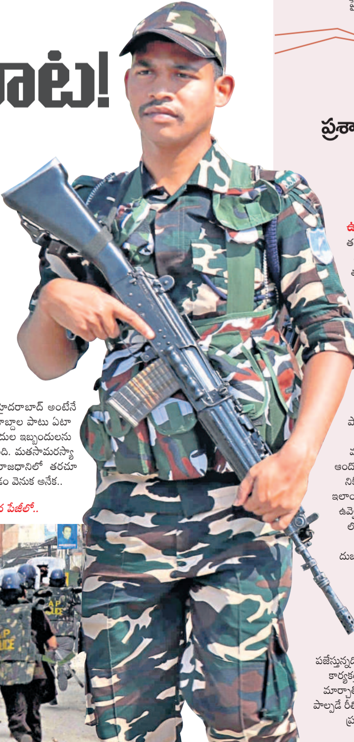
మిగతా 8వ వేటిలో..