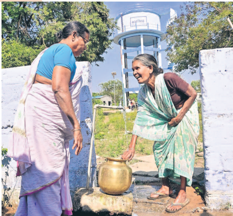
మిషన్ భగీరథ ఫలితాలు ఏ వట్టూనికో పరిమితం కాలేదు. ఇండ్రవెల్లి కాన నుంచి ఇల్లందు కోసం వరకు భగీరథ జలాలు జనాల గొంతు తడిపాయి. కండ్లముందుకు వచ్చిన గంగమ్మను చూసి మునలమ్మలు ఇలాంటి రోజు వస్తుందని ఏనాడూ ఊహించలేదని మునిపాతున్నారు. తరతరాలుగా చూసిన కానుకను అందించిన ముఖ్యమంత్రి కేసీఆర్ ను నిత్యం తలమకుంటున్నారు. ఇల్లందు మండలం విజయలక్ష్మీనగర్లో భగీరథ బ్యాంక్ నీడలో నీళ్లు వట్టుకుంటున్న ఈ పువ్వు ఇప్పుడు నిత్య సంతోషిణి.