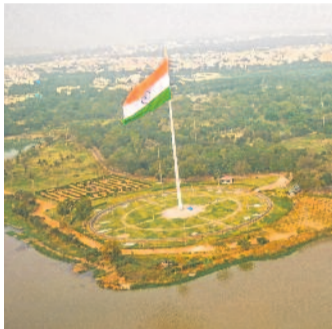
హుస్సేన్ సాగర్ తీరాం తీరంగా రెవరెవలు

జలాశయం చుట్టూ హైదరాబాద్ మహా నగరం సరికొత్త సాబగులతో ముస్తాబు చేస్తున్నది. సచివాలయం ఎదుట నిర్మించిన మ్యూజికల్ ఫౌంటేన్ నగర వాసులతో పాటు ఇతర ప్రాంతాల, విదేశీ పర్యాటకులకు ఆహ్లాదాన్నిస్తున్నది.