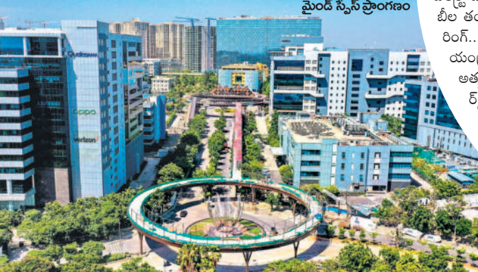
మెంట్ స్పేస్ ప్రాంగణం

తెలంగాణ రాష్ట్రం ఏర్పడే నాటికి 2013-14 వార్షిక సంవత్సరంలో ఐటీ ఎగుమతులు రూ.57,258 కోట్లు ఉంటే 2022-2023లో రూ.2,41,275 కోట్లకు పెరిగింది. వ్యర్ధిటు వివరంగా 31.44 శాతంగా నమోదైంది. 9,05,715 మందికి (2023 మార్చి నాటికి) ఉద్యోగ అవకాశాలతో పాటు ఐటీ ఎగుమతులు 4 రెట్లు పెరిగాయి. ప్రభుత్వం ఐటీ రంగంపై చూపిన ప్రత్యేక చొరవతో ప్రత్యేక రాష్ట్రంలో ఐటీ రంగం ముఖ్య చిత్రమై మారిపోయింది. మరోవైపు పెట్టుబడులకు కేంద్రంగా నిలిచింది. మొత్తంగా గత 9 వార్షిక సంవత్సరాల్లో రాష్ట్రంలో ఐటీ ముఖ్య చిత్రం ఒకసారిగా మారిపోయింది.