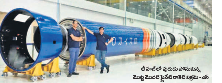
టీ హబ్ లో పురుషుల పాపాకున్న మొట్ట మొదటి ప్రైవేట్ రాకెట్ విక్రమ్ -ఎస్