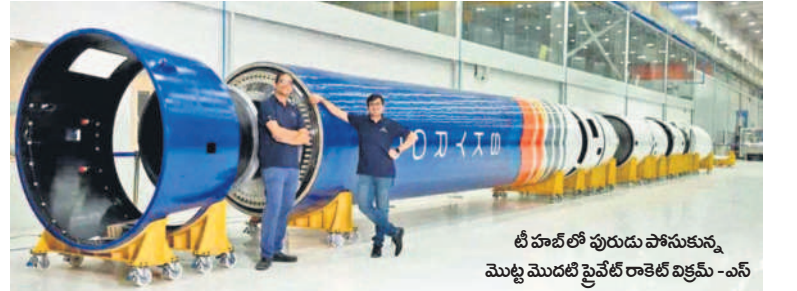
టీ హబ్ లో పురుగు పోసుకున్న మొట్ట మొదటి ప్రైవేట్ రాకెట్ విక్రమ్ -ఎస్