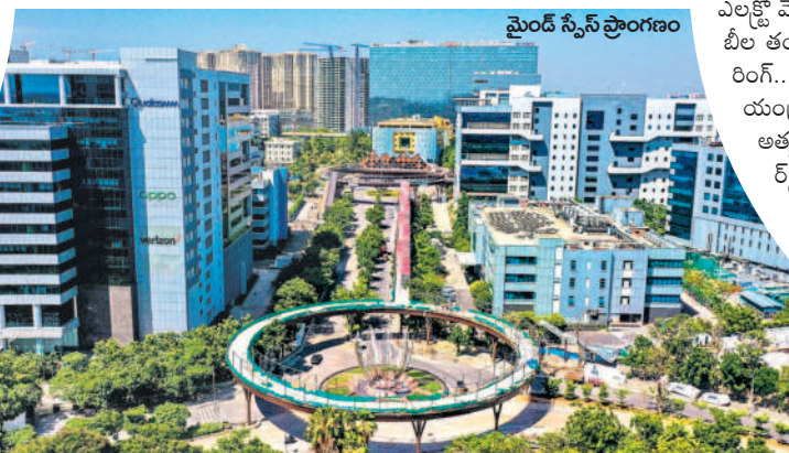
మెంట్ స్పేస్ ప్రాంగణం

తెలంగాణ రాష్ట్రం ఏర్పడే నాటికి 2013-14 వార్షిక సంవత్సరంలో ఐటీ ఎగుమతులు రూ.57,258 కోట్లు ఉంటే 2022-2023లో రూ.2,41,275 కోట్లకు పెరిగింది. వ్యర్ధిటు వివరంగా 31.44 శాతంగా నమోదైంది. 9,05,715 మందికి (2023 మార్చి నాటికి) ఉద్యోగ అవకాశాలతో పాటు ఐటీ ఎగుమతులు 4 రెట్లు పెరిగాయి. ప్రభుత్వం ఐటీ రంగంపై చూపిన ప్రత్యేక చొరవతో ప్రత్యేక రాష్ట్రంలో ఐటీ రంగం ముఖ్య చిత్రమై మారిపోయింది. మరోవైపు పెట్టుబడులకు కేంద్రంగా నిలిచింది. మొత్తంగా గత 9 వార్షిక సంవత్సరాల్లో రాష్ట్రంలో ఐటీ ముఖ్య చిత్రం ఒకసారిగా మారిపోయింది.