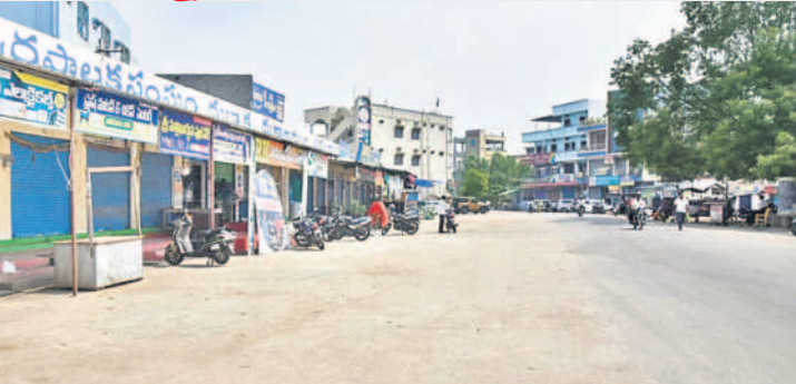
సిద్దిపేట జిల్లా దుబ్బాకలో నిర్వాహకంగా మారిన ప్రధాన రహదారి