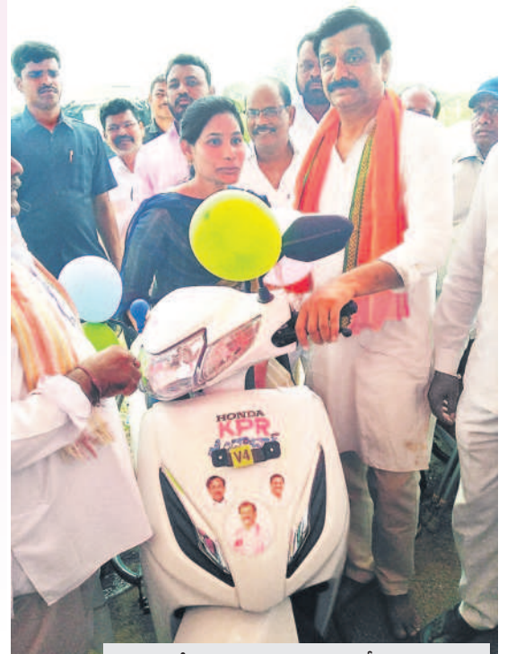
దుబ్బాకలో దివ్యాంగులకు మెదక్ ఎంపీ కొత్త ప్రభాకర్ రెడ్డి తన సొంత డబ్బులతో దివ్యాంగురాలికి స్కూటీ అందజేస్తున్న దృశ్యం (ఫైల్)