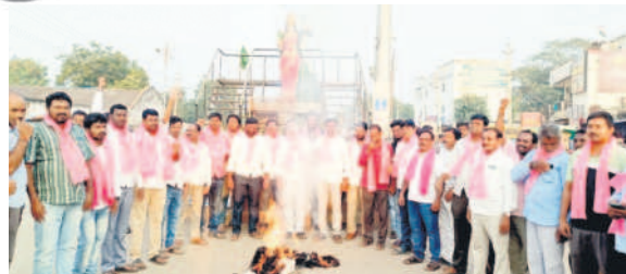
చెన్నూర్ లో కాంగ్రెస్ పార్టీ దిష్టిబొమ్మను దహనం చేస్తున్న బీఆర్ఎస్ నాయకులు