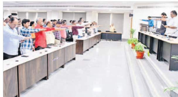
జాతీయ సమైక్యతా దినోత్సవాన్ని పురస్కరించుకొని అధికారులతో ప్రతిజ్ఞ చేయిస్తున్న కలెక్టర్

రని గుర్తు చేశారు. దీనికి గానూ దేశం ఆయన సేవలను స్మరిస్తూ ప్రతి ఏడాది అక్టోబర్ 31న సర్దార్ వల్లభాయ్ పటేల్ జయంతిని జాతీయ సమైక్యతా దినోత్సవంగా నిర్వహించుకుంటున్నట్లు తెలిపారు. దేశంలోని ఏకైక, శాంతి, సమానత్వం, సామ్రాజ్యత్వంతో రాజ్యాంగం అమలులోకి వచ్చి రాష్ట్రాల్లో జిల్లాలో రాజ్యాంగపరమైన పాలన కొనసాగుతుందన్నారు. దేశంలో ప్రతి పౌరుడు ఐకమత్యంతో చట్టాలను గౌరవిస్తూ దేశ సమగ్రత, సమైక్యత కోసం పాటుపడాలన్నారు. అలాగే ప్రజాస్వామ్యంలో