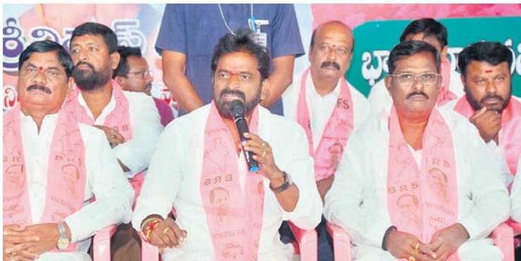
విలేకరుల సమావేశంలో మాట్లాడుతున్న మంత్రి శ్రీనివాస్ గౌడ్

- నాగర్ కర్నూల్, అక్టోబర్ 31 (నమస్తే తెలంగాణ)