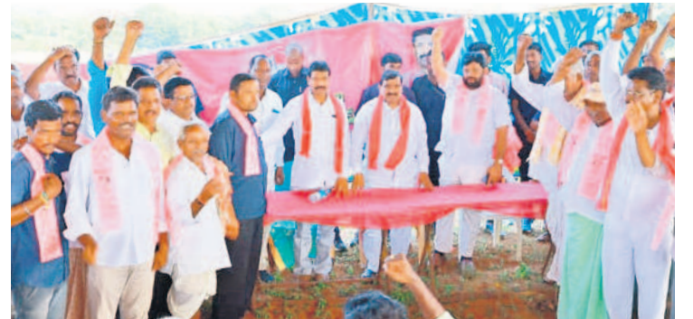
బీఆర్ఎస్ లో చేరిన వారితో మంత్రి పట్నం మహేందర్ రెడ్డి, చిత్రంలో ఎమ్మెల్యే పట్నం నరేందర్ రెడ్డి