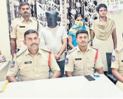
నిందితులను అరెస్టు చేస్తూ పోలీసులు