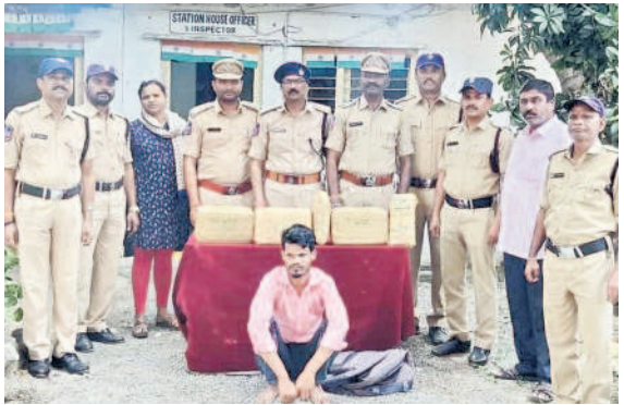
కాజీపేటలో నిందితుడిని అరెస్ట్ చేస్తూ ఎక్స్‌జె పోలీసులు