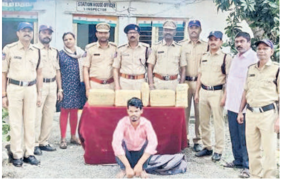
కాజీపేటలో నిందితుడిని అరెస్టు చేసినట్లు ఎక్స్‌జె పోలీసులు