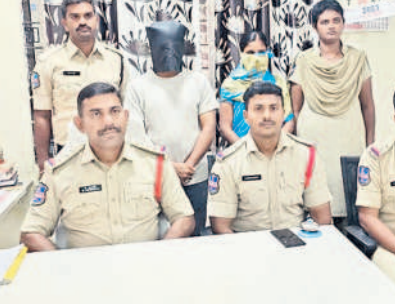
నిందితులను అరెస్టు చేసినట్లు పోలీసులు