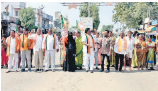
బెల్లంపల్లి పాత బస్టాండ్ వద్ద రాస్తారోకో చేస్తున్న బీజేపీ నాయకులు