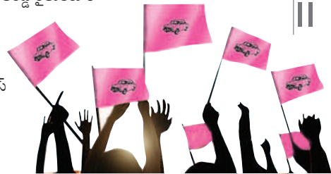
- మిర్యాలగూడ/దేవరకొండ, అక్టోబర్ 31