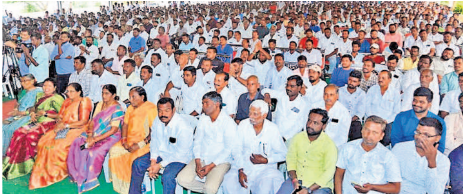
సిద్దిపేటలో సమావేశానికి హాజరైన కార్యకర్తలు, నాయకులు

మెజార్టీతో పోటీ పడతాం బెదిండ్లుగా అభివృద్ధి చేశారు, అండగా ఉన్నారు, ఈ నెల రోజులు మీ గురించి కష్టపడతాం. మేము పోటాపోటీగా ప్రచారం చేస్తామని ముక్తకంఠంతో బీఆర్ఎస్ కార్యకర్తలు నినదించారు. రాష్ట్రంలో చీడ పురుగులు తిరుగుతున్నాయి. అలాంటి చీడ పురుగులను తరిమివేయాలంటే.. బీఆర్ఎస్ హ్యూట్రీక్ సాధించాలి. సిద్దిపేటలో మేము మీ గురించి పని చేస్తామంటూ మంత్రి హరీశ్ రావును ఉద్దేశించి బీఆర్ఎస్ కార్యకర్తలు, నాయకులు ముక్తకంఠంతో నినదించారు. ఈ ఎన్నికల్లో కష్టపడి మరోసారి లక్ష మెజార్టీ దాటిస్తామని స్పష్టం చేశారు. ఈ సమావేశంలో