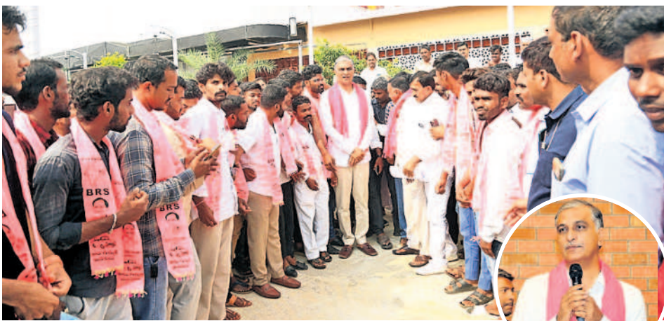
బీఆర్ఎస్ లో చేరిన అదవిమజిద్ గ్రామానికి చెందిన మైనార్టీ యువకులతో మంత్రి హరీశ్ రావు

గజ్వేల్, అక్టోబర్ 31: గజ్వేల్ నుంచి మూడో సారి ఎమ్మెల్యేగా గెలిచేది, హ్యూట్రీక్ ముఖ్యమంత్రిగా బాధ్యతలు స్వీకరించేది కేసీఆర్ అని, అందుకు ప్రతి కార్యక్రమం ప్రభుత్వం చేపట్టిన అభివృద్ధి, సంక్షేమ పథకాల గురించి నెల రోజులపాటు ప్రజలకు వివరించాలని ఆర్థిక, వైద్యారోగ్య శాఖల మంత్రి హరీశ్ రావు అన్నారు. మంగళవారం గజ్వేల్ ఆర్ అండ్ ఆర్ కాలనీ, నియోజకవర్గ ముఖ్య కార్యకర్తలతో ఏర్పాటు చేసిన సమావేశానికి హాజరై మాట్లాడారు. గజ్వేల్ పట్టణ అభివృద్ధికి బృహత్ ప్రణాళిక ఉందని, సీఎం కేసీఆర్ సహకారంతోనే గడిచిన తొమ్మిదిన్నరేండ్ల కాలంలో పట్టణ రూపురేఖలు మారుతున్నామన్నారు. దాబోయే రోజుల్లో మరంత అభివృద్ధి జరుగుతుందని, సీఎం కేసీఆర్ గజ్వేల్ ఎమ్మెల్యేగా ఉండడం ఇక్కడి ప్రజల అదృష్టమన్నారు. గత ప్రభుత్వాల హయాంలో పేదలను పట్టించుకోలేదని, స్వరాష్ట్రంలో పేదల కోసం సీఎం కేసీఆర్ ఎన్నో పథకాలను తీసుకువచ్చారన్నారు. గజ్వేల్ దవాఖాన పేదలకు మెరుగైన వైద్య సేవలు అందిస్తున్నదన్నారు. దేశంలో ఎక్కడా లేనంతగా ఆర్ అండ్ ఆర్ కాలనీ నిర్మాణం జరిగిందన్నారు. మిగిలిన 5, 10 శాతం పనులను కూడా త్వరలోనే పూర్తి చేస్తామని హామీ ఇచ్చారు. ఇంకా కొంత మంది అర్హులు లబ్ధిపొందేవారు ఉన్నారని, చెక్కుల విషయంలో సాంకేతిక ఇబ్బందులు, కొన్ని ప్లాట్లు కోర్టు కేసుల కారణంగా రిజిస్ట్రేషన్ కాలేదన్నారు. అన్ని వర్గాల ప్రజలను దృష్టిలో ఉంచుకొని శుభాసనాటికలకు స్థలాలు కేటాయించి పూర్తి చేస్తామన్నారు. ఇంకొంత మందికి ఇంటి స్థలాలు వచ్చేది ఉందని, వారందరి త్వరలోనే అందిస్తామన్నారు. యువతపై ప్రత్యేక దృష్టి సారించినట్లు తెలిపారు. ఉద్యోగ, ఉపాధి అవకాశాల కోసం శిక్షణా కేంద్రాలను ఏర్పాటు చేస్తామన్నారు. మనందరికీ పెద్ద దిక్కుగా సీఎం కేసీఆర్ ఉన్నారని చెప్పారు.