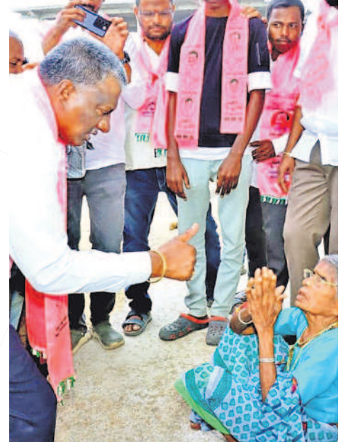
పరిగి మున్సిపల్ పరిధిలోని మూడవ వార్డులో అవ్వతో ఎమ్మెల్యే మహేందర్ రెడ్డి ఆత్మీయ సంభాషణ