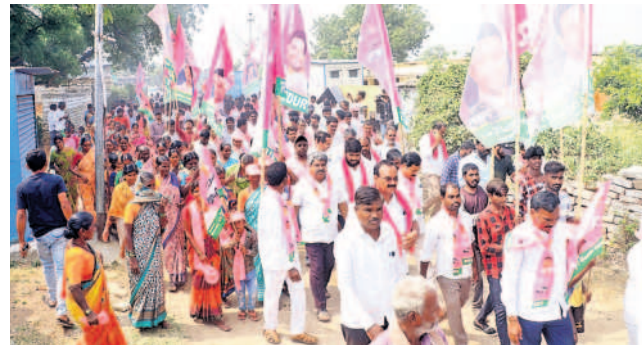
మైలార్ గ్రామంలో నిర్వహించిన ర్యాలీలో పాల్గొన్న బీఆర్ఎస్ శ్రేణులు