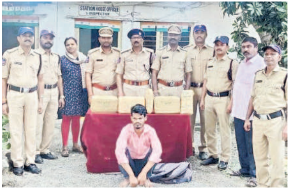
కాజీపేటలో నిందితుడిని అరెస్టు చేసినట్లు ఎక్స్‌జె పోలీసులు