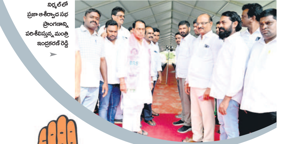
నిర్మల్ లో ప్రజా ఆశీర్వాద సభ ప్రాంగణాన్ని పరిశీలిస్తున్న మంత్రి ఇంద్రకరణ్ రెడ్డి

- మంచిర్యాల, నవంబర్ 1 (నమస్తే తెలంగాణ ప్రతినిధి)