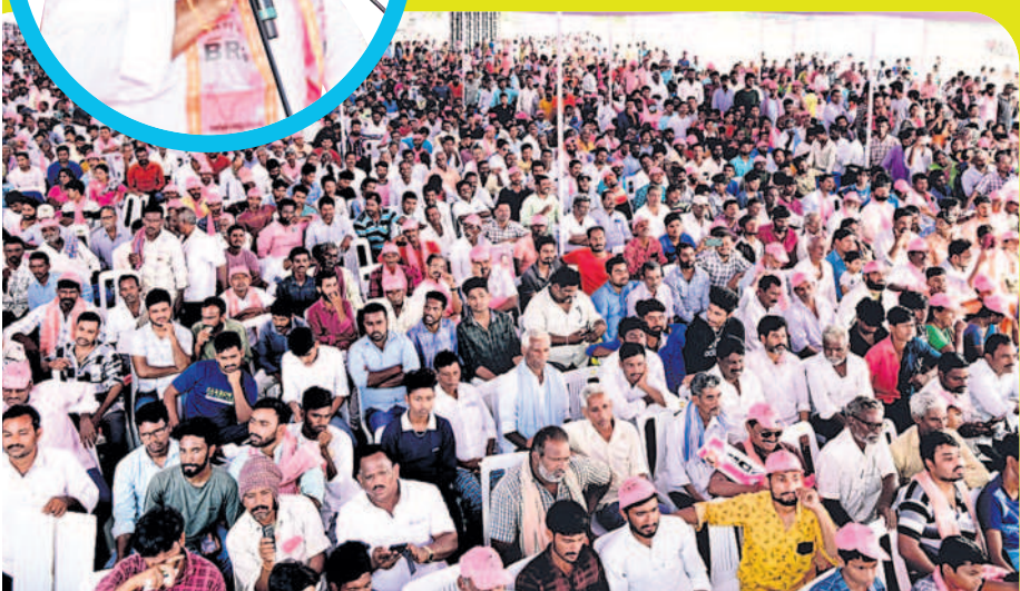
కల్లూరులో సీఎం కేసీఆర్ ప్రజా ఆశీర్వాద సభకు హాజరైన ప్రజలు, బీఆర్ఎస్ శ్రేణులు