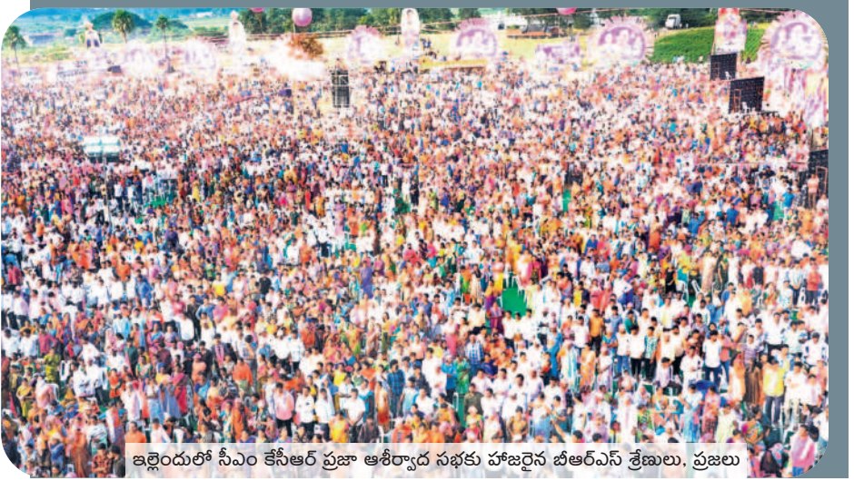
ఇల్లెందులో సీఎం కేసీఆర్ ప్రజా ఆశీర్వాద సభకు హాజరైన బీఆర్ఎస్ శ్రేణులు, ప్రజలు