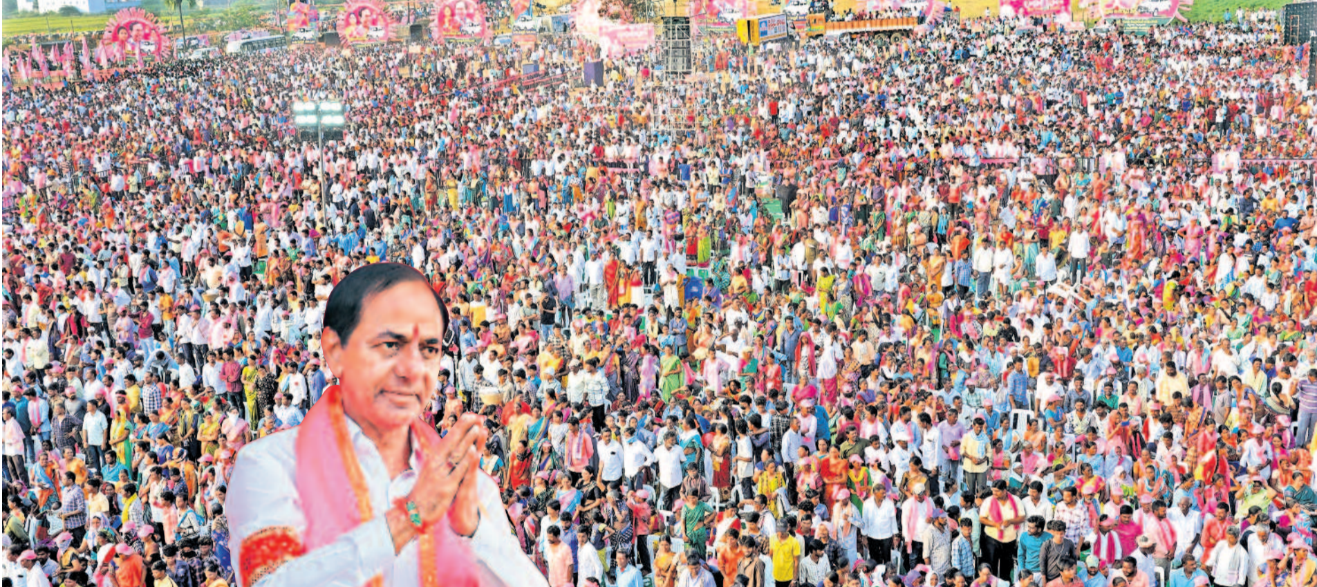
ఇల్లందు ప్రజా ఆశీర్వాద సభకు హాజరైన ఆశీర్వాద జనసాహసారికి లభించిన చెన్నై సీఎం కేసీఆర్

ఇవాళ పెదబొబ్బలు పెట్టే మూడు రంగుల జెండాలు, ఎర్రరేఖ జెండాలు, పచ్చరంగుల జెండాలు దళితులకు ఏం జేస్తాయి? గుండెమీద చెయ్యని అక్కలిమిపై చేసుకోవాలి.. ఏ జెండా ఏం చేయాలి.. దళితులను ఓటు బ్యాంకుగా వాడుకున్నారే. ప్రధాని మోదీకి ప్రైవేట్ జేషన్ వీల్చి పట్టుకున్నది. విమానాశ్రయాలు, నౌకాశ్రయాలు, రైల్వేలు అన్నీ ప్రైవేటీకరణ చేస్తున్నారు. దివంగి ఈ దేశాన్ని ఏం చేస్తారో! -సీఎం కేసీఆర్