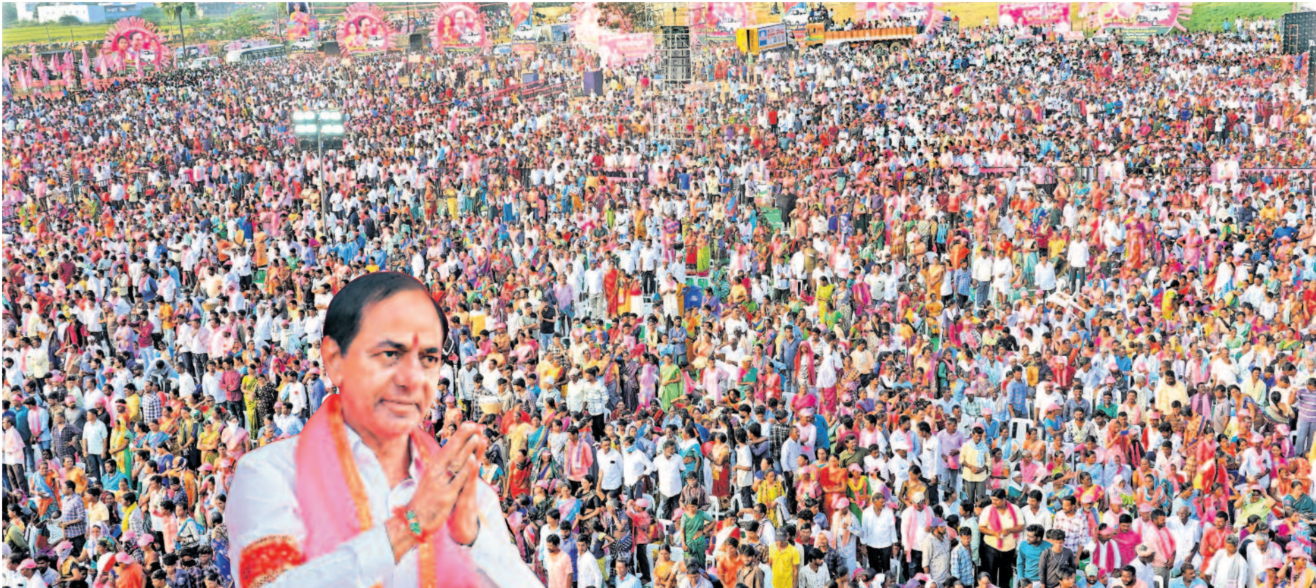
ఇల్లందు ప్రజా ఆశీర్వాద సభకు హాజరైన ఆసీప జనసాహసీకి లభించిన చెన్నై సీఎం కేసీఆర్

ఇవాళ పెదబొబ్బలు పెట్టే మూడు రంగుల జెండాలు, ఎర్రరేఖ జెండాలు, పచ్చరంగుల జెండాలు దళితులకు ఏం జేస్తాయి? గుండెమీద చెయ్యిన అక్కలిమర్లు చేసుకోవాలి.. ఏ జెండా ఏం చేయాలి.. దళితులను ఓటు బ్యాంకుగా వాడుకున్నరు. ప్రధాని మోదీకి ప్రైవేట్ జేషన్ వీల్చి పట్టుకున్నది. విమానాశ్రయాలు, నౌకాశ్రయాలు, రైల్వేలు అన్నీ ప్రైవేటీకరణ చేస్తున్నారు. దివంగి ఈ దేశాన్ని ఏం చేస్తారో! -సీఎం కేసీఆర్