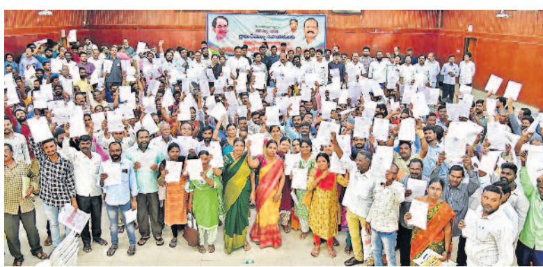
ఉద్యోగ నియామక వత్రాలతో బీఆర్ఎస్ (పైల)

• సమైక్య కాంగ్రెస్ ప్రభుత్వ పాలనలో కలగా కొలువుల భర్తీ • రాష్ట్రమొస్తే ఏమొస్తేది అన్నోళ్ళకు 'జవాబ్.. జవాబ్'