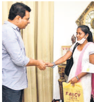
జీహెచ్ఎస్ఐలో జాబ్ సాధించిన రజనీకా అధినందనల తెలిపిన మంత్రి కేటీఆర్ (పైల)

'తెలంగాణ వస్తే ఏమొస్తే' అన్నోళ్ళకు పదేండ్లలోనే సమాధానం డొరికింది. తెలంగాణ వస్తే 'మా కొలువులు మాకే వస్తాయి' అనేది రుజువుయింది. స్వరాష్ట్రం సిద్ధించిన తర్వాత.. తొమ్మిదన్నరేండ్లలోనే 2,32,308 ఉద్యోగాలకు రాష్ట్ర ఆర్థికశాఖ అనుమతి ఇచ్చింది. అందులో నియామక సంఖ్యలు 27 శాఖల్లో 2,02,735 ఉద్యోగాల భర్తీకి నోటిఫికేషన్లు ఇచ్చాయి.