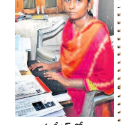
జీజీఎస్ఐలో కంప్యూటర్ ఆపరేటర్ గా..