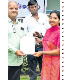
కారుణ్య నియామకం (పైల)