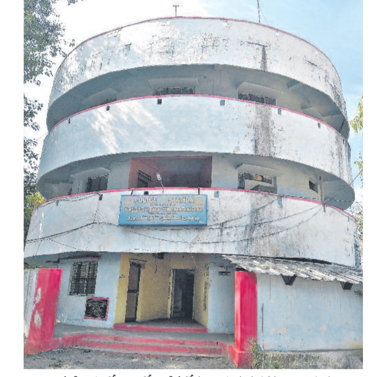
ఉమ్మడి రాష్ట్రంలో బూజుతో విండిన గోడలు, ఎప్పుడూ కూలిపోతాయో తెలియని భద్రతలు...