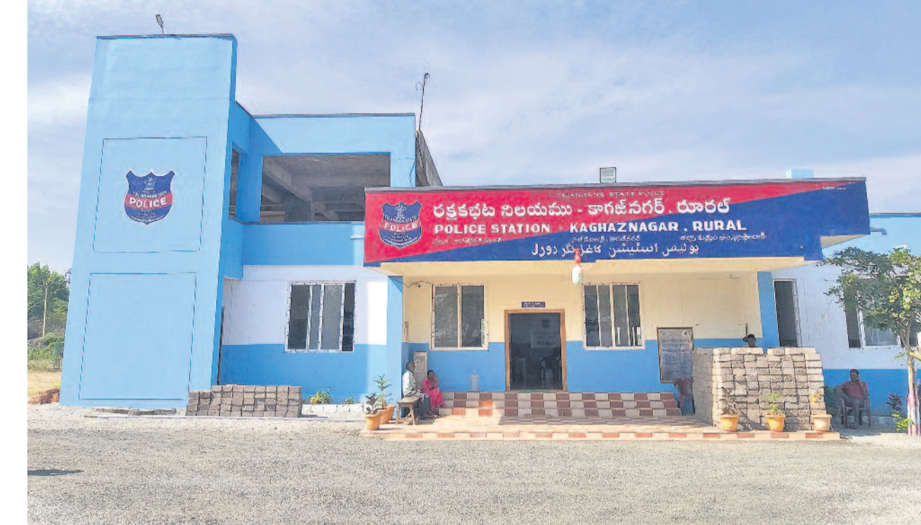
కొత్త రాష్ట్రంలో కాంట్రీబిల్డింగ్ కరువు అవుతాయన్న వాదనను తిప్పి కొట్టింది తెలంగాణ రాష్ట్రం.