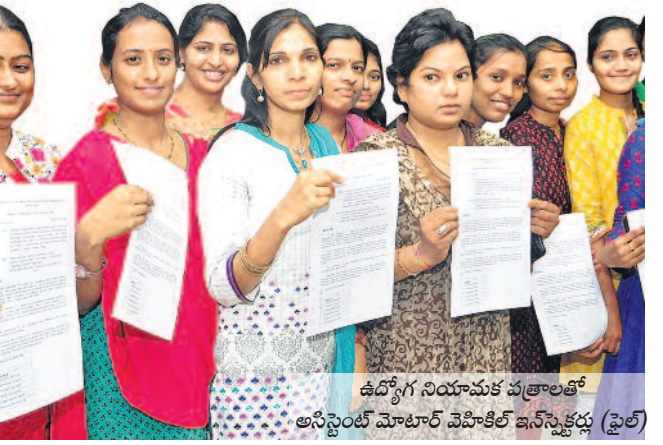
ఉద్యోగ నియామక పత్రాలతో అసిస్టెంట్ మాజీలలో పోలిస్ బీఆర్ఎస్ కు (ఫైల్)

కాంగ్రెస్ పోలిస్ 16 రెట్లు ఎక్కువ.. తెలంగాణ ఆవిర్భావం కంటే ముందు రాష్ట్రంలో అధికారంలో ఉన్నది కాంగ్రెస్ పార్టీ. 2004 నుంచి 2014 వరకు కాంగ్రెస్ ప్రభుత్వ హయాంలో ఉమ్మడి ఆంధ్రప్రదేశ్ లో భర్తీ చేసిన ఉద్యోగాలు 24,086 మాత్రమే.