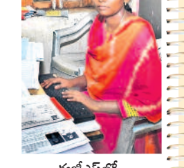
ఉజ్జ్వలన్ లో కంప్యూటర్ ఆపరేటర్ గా..