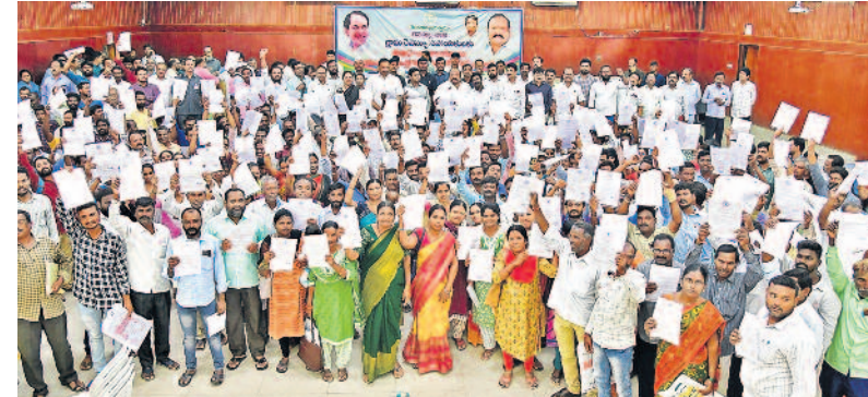
ఉద్యోగ నియామక పత్రాలతో బీఆర్ఎస్ (ఫైల్)

ముఖ్యమంత్రి కల్లకుంట్ల చంద్రశేఖర్ రావు మొత్తం దిక్ష, కార్యక్షణ, విజనన తొలగించింది. ప్రత్యేకంగా ఉద్యోగాల భర్తీలో తెలంగాణ దేశంలోనే సంబర వనిగా నిలిచింది.