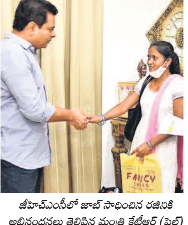
జీహెచ్ఎస్ఐలో జాబ్ సాధించిన రజనీకా తిలినందలను తెలిపిన మంత్రి కేటీఆర్ (ఫైల్)

వెలుగుల రేడు బీకటి రోజులు మళ్ళీ వచ్చి వెలుగుల రేడే మనకు ముద్దు ఉదయ నేతక జైకోట్లు మైకానులను తలమి కొట్టు