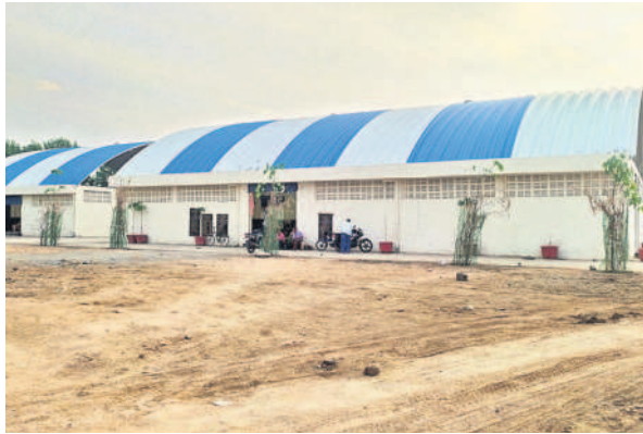
ధర్మపురిలో రూ.4కోట్లతో నిర్మించిన ఇంటర్నెట్ మాస్టర్

అన్ని మతాలను గౌరవిస్తూ నియోజకవర్గంలోని చర్మిలు, కల్లస్టాన్లు, మజీదుల నిర్మాణాలు, మరమ్మత్తులకు ₹14.39కోట్లు వెచ్చించారు. ఇందులో ఖల్లస్టాన్, మసీదులకు ₹4.74కోట్లు, చర్మిల మరమ్మత్తుకు ₹9.65కోట్లు వెచ్చించారు.